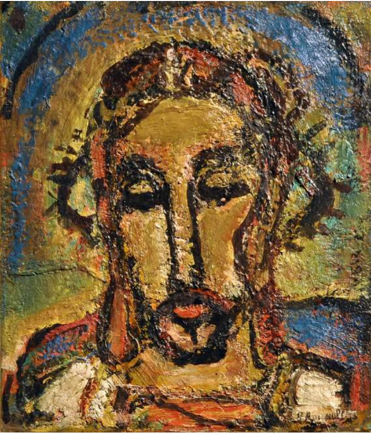
Rouault – Ecce Homo – 1952

est indéfectible, car Dieu est fidèle. En contemplant le Crucifié, nous réalisons à quel point nous sommes aimés : « Oui, j'en ai l'assurance : ni la mort ni la vie...ni aucune créature, rien ne pourra nous séparer de l'amour de Dieu manifesté en Jésus Christ notre Seigneur » (Rm 8, 38-39).