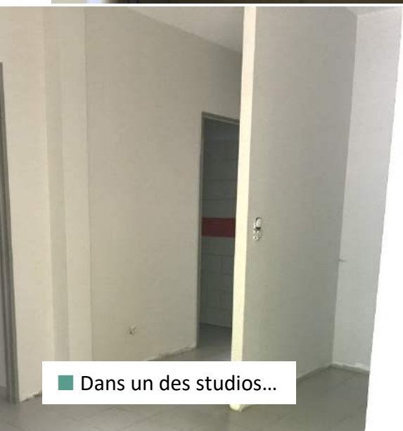
■ Dans un des studios...