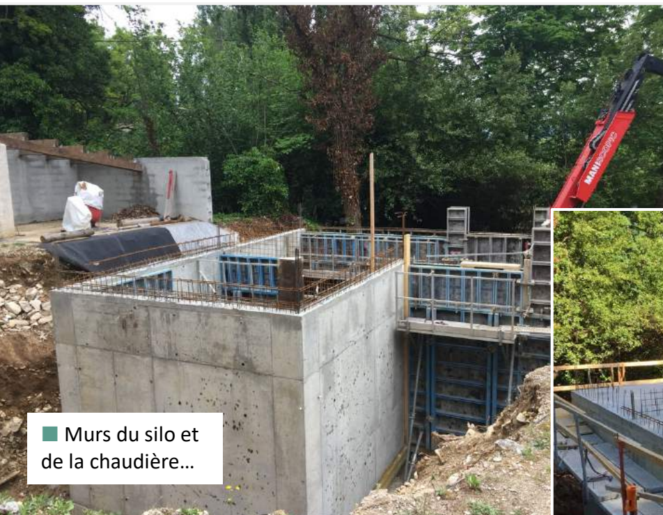
■ Murs du silo et de la chaudière...