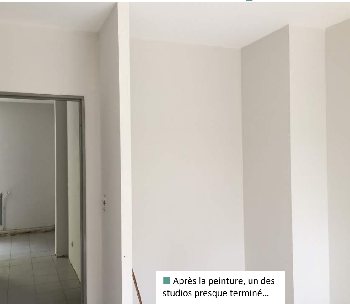
■ Après la peinture, un des studios presque terminé...