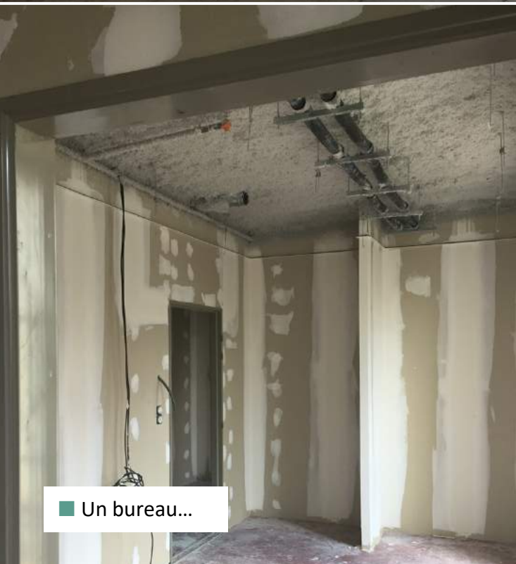
■ Un bureau...