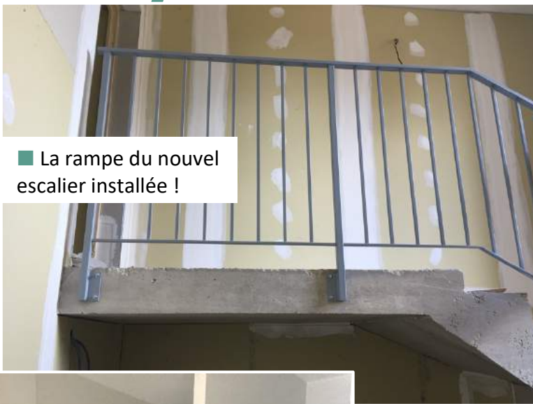
■ La rampe du nouvel escalier installée !