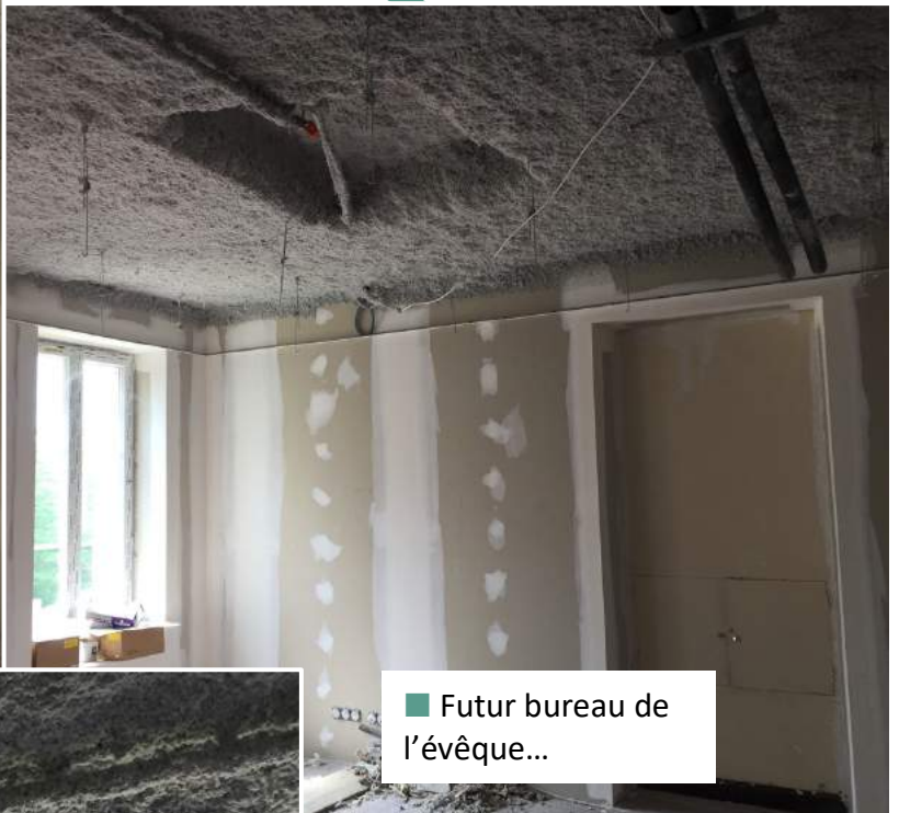
■ Futur bureau de l'évêque...