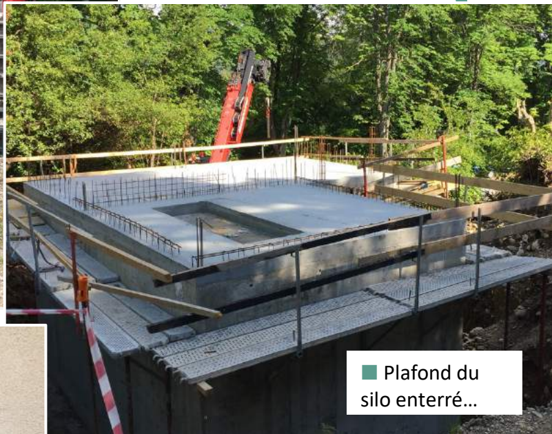
■ Plafond du silo enterré...