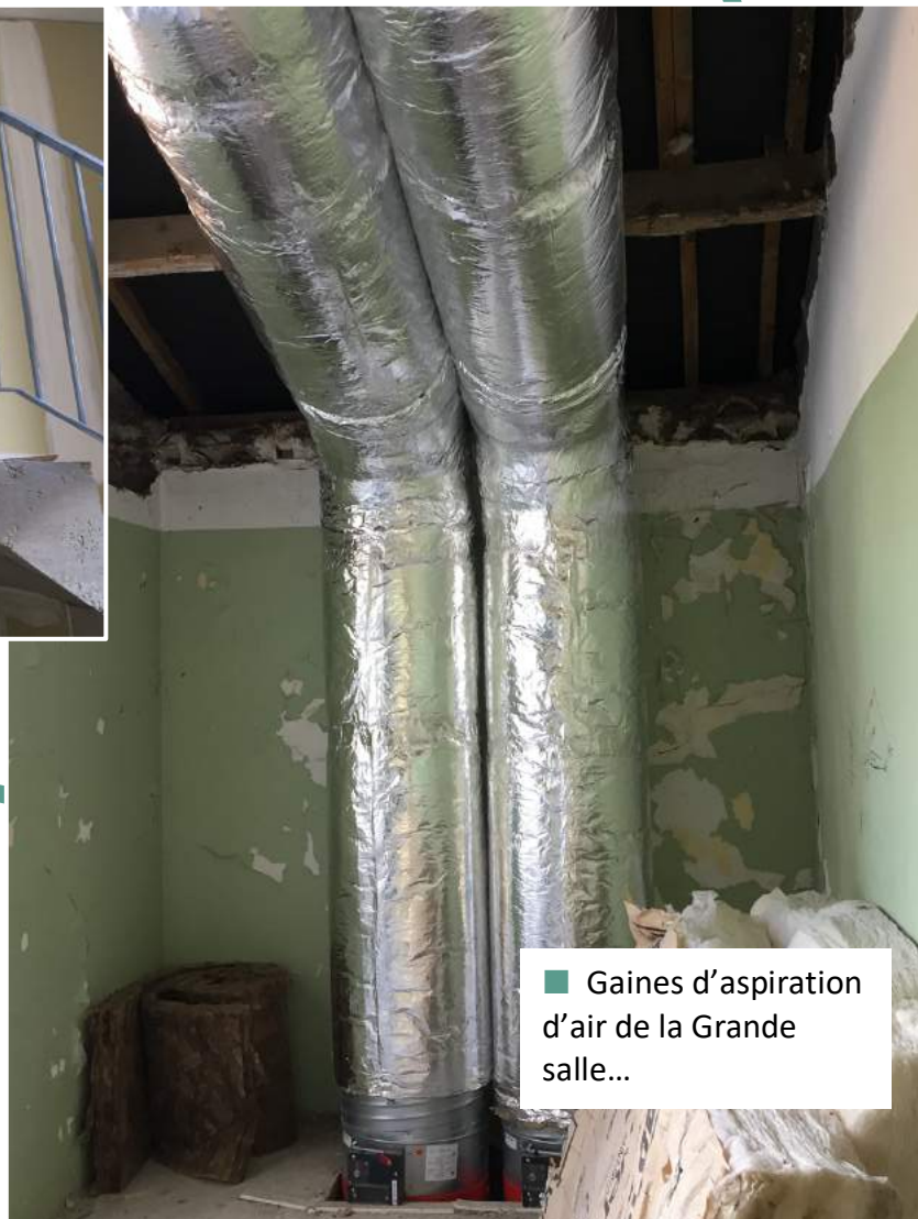
■ Gaines d'aspiration d'air de la Grande salle...