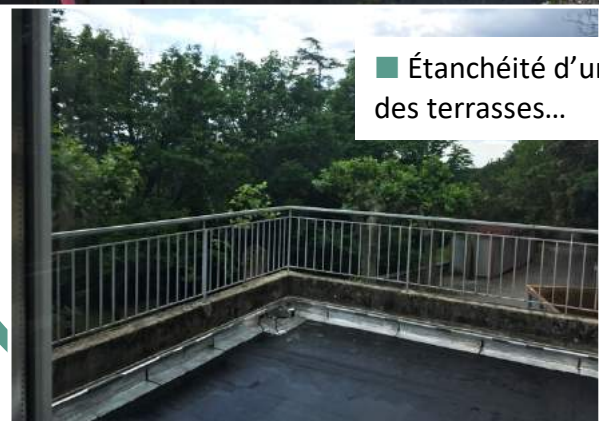
■ Étanchéité d'une des terrasses...

A suivre dans les prochains numéros de "Bartèu - Le Mag"... sur notre site dédié