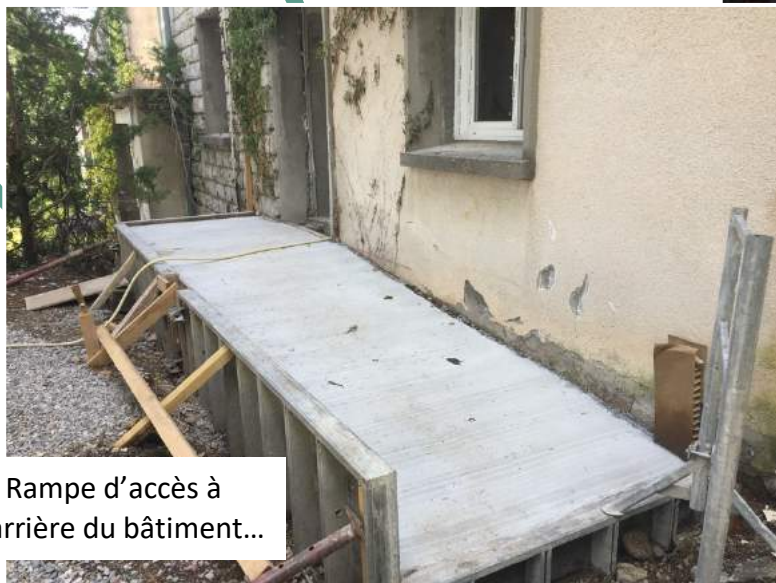
■ Rampe d'accès à l'arrière du bâtiment...